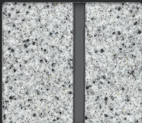
▲NT-3 テープ目地工法(目地色 F-4 目地幅6mm)