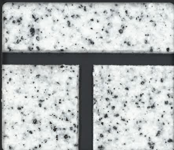
▲NT-2 テープ目地工法(目地色 F-3 目地幅6mm)