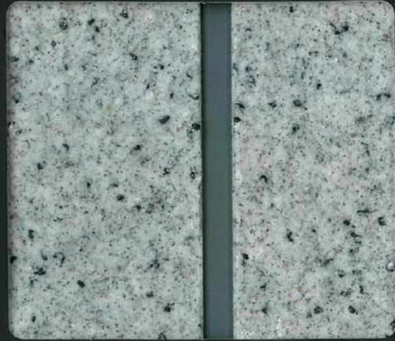
▲NT-3 テープ目地工法 (目地色 F-4)